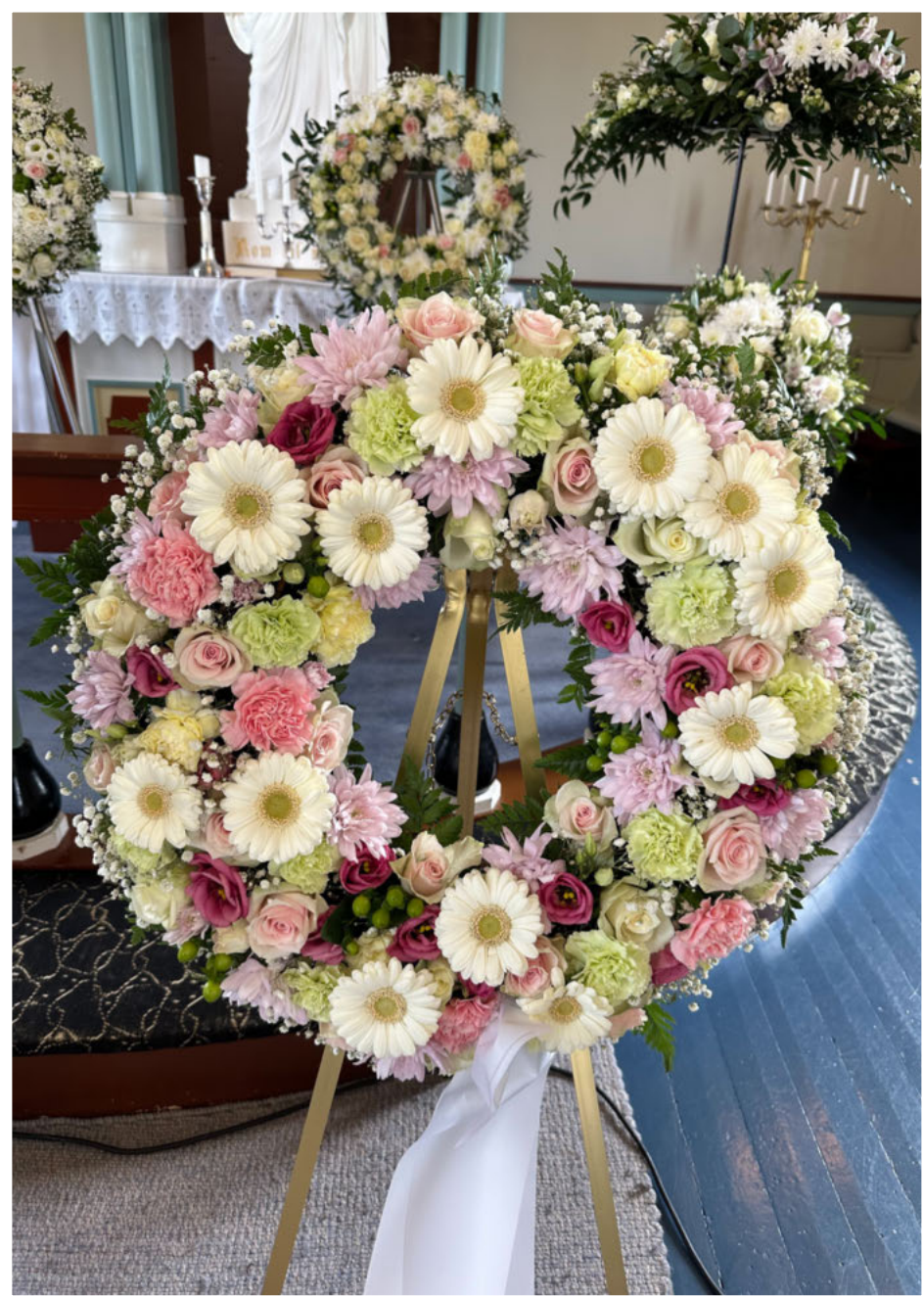
Et aller siste farvel til en kjær venn og kollega. Hilsen Brages Bilforetning