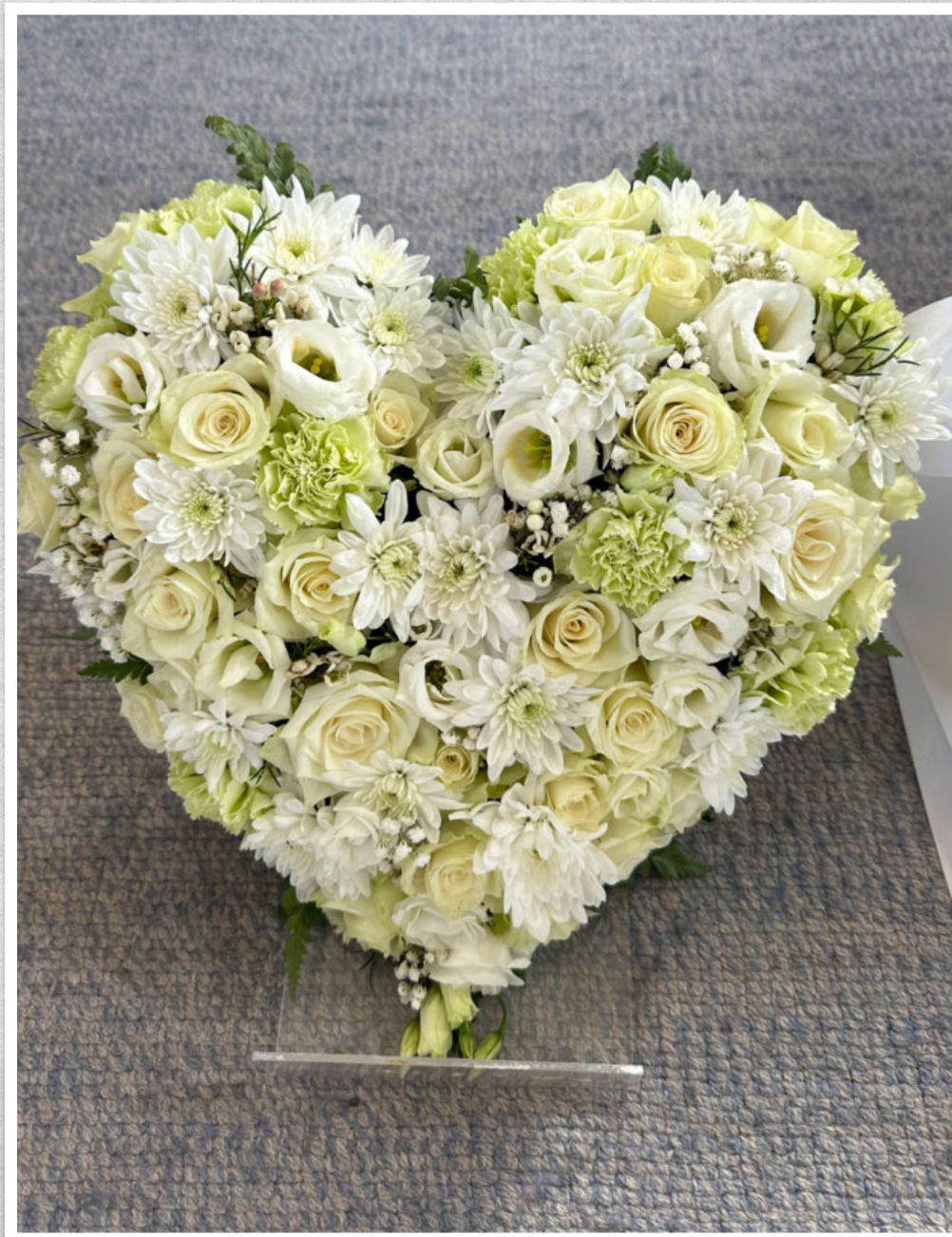
Takk for alle de gode stundene vi hadde sammen. Fra gjengen fra Lefdal.