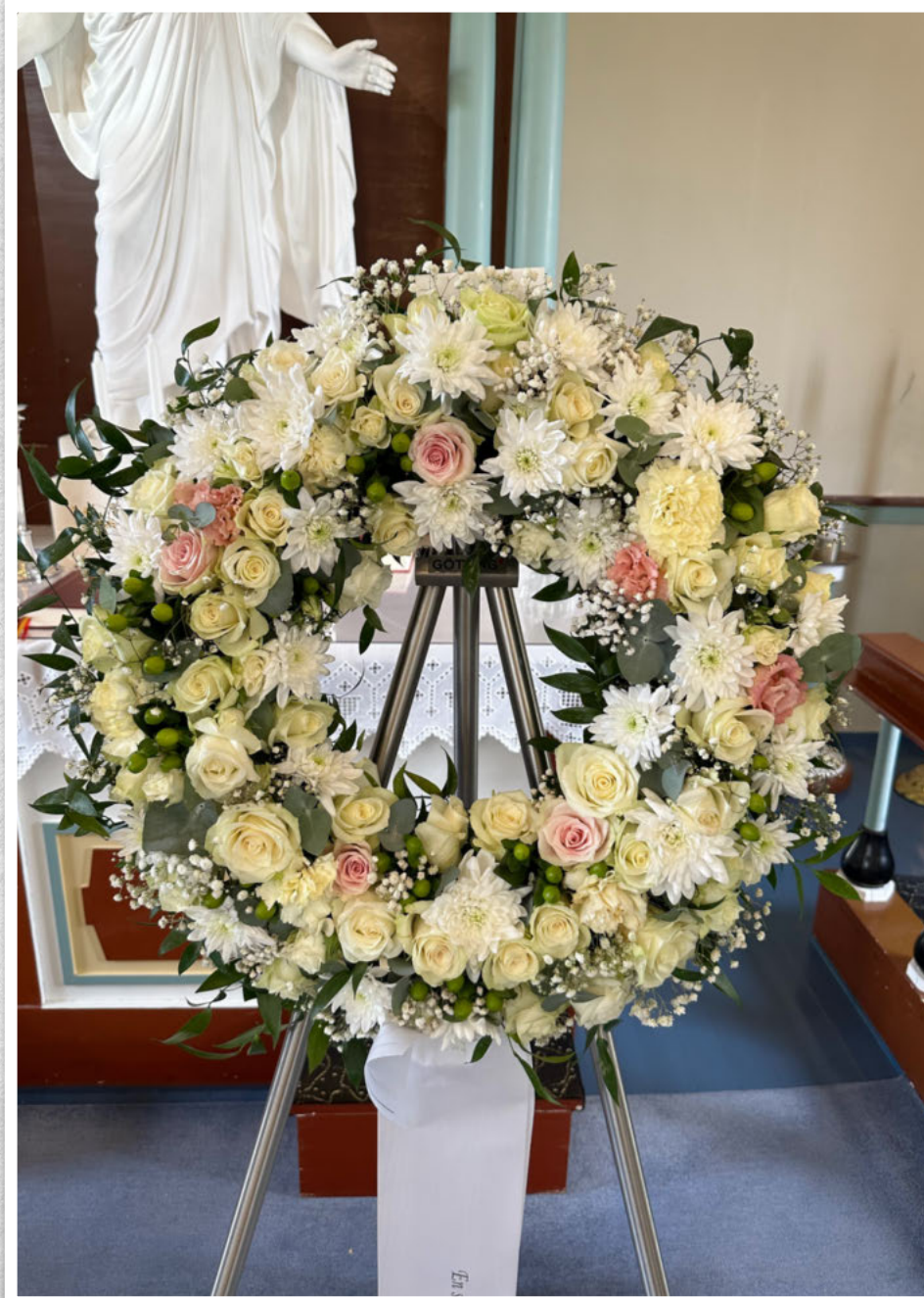
En siste hilsen og takk for innsatsen. Toyota Norge.