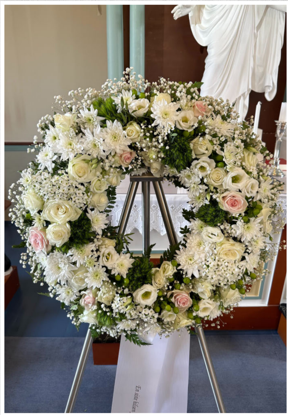
En siste hilsen fra ML14-kullet.