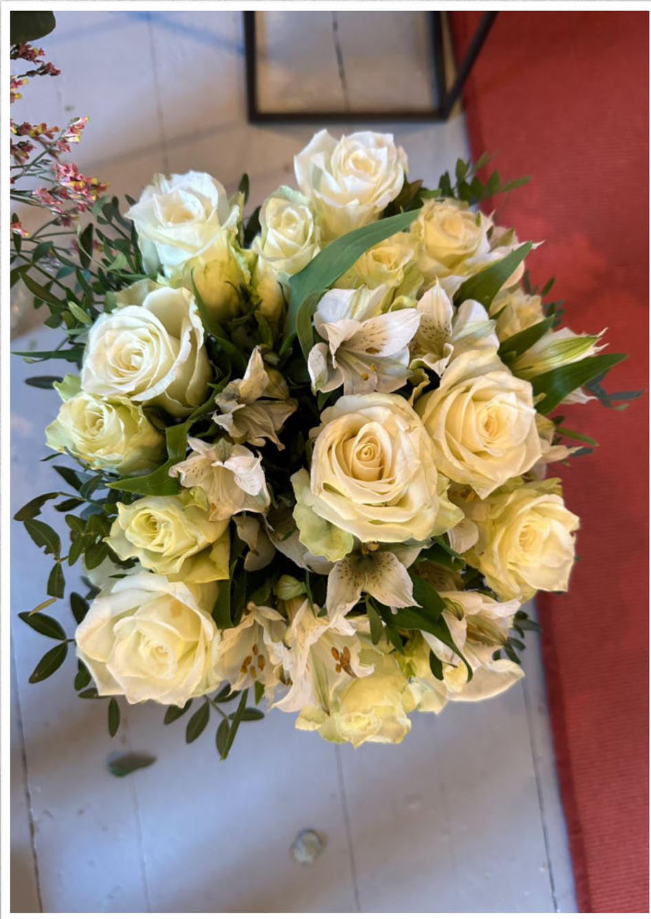
Takk for alle gode minne. Ei siste helsing frå Sigrun Hove med familie.