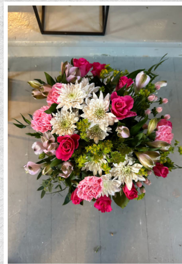
Ei siste helsing frå Björg Vad, Leif-Magne og Oddbjørn med familier.