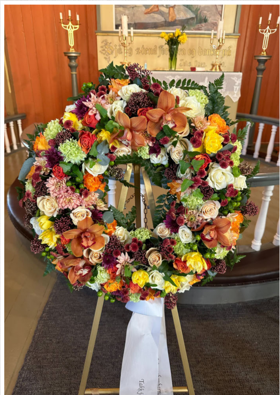
Takk for alle gode minne. Ei siste helsing frå søskenbarna på Røsoksida. Kvil i fred.