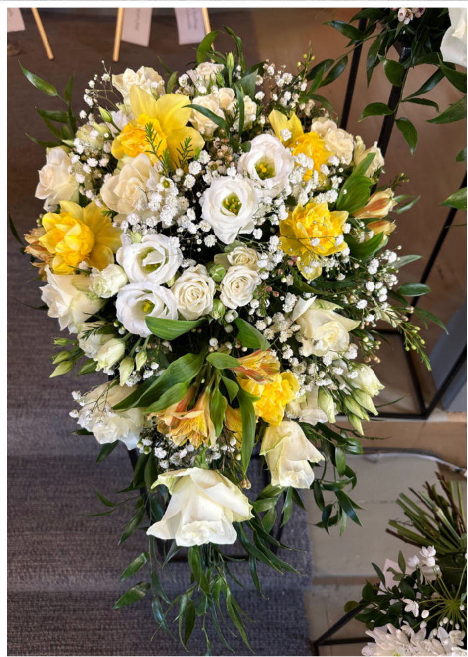
En siste hilsen fra Dalebu og Oasen.