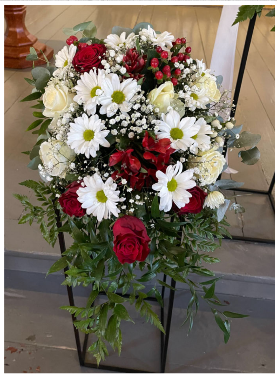
Ei siste helsing frå Landsforeningen for nyrepasienter og transplanterte/besøkstenesta Møre og Romsdal Fylkeslag.