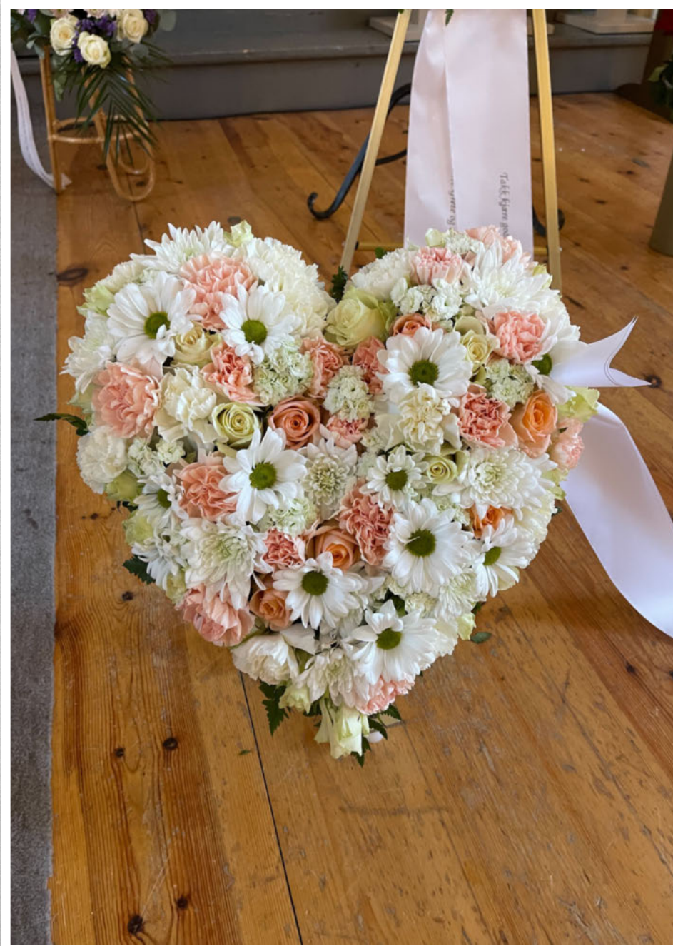
En siste hilsen fra kollegaer på Alderspsykiatrisk sengepost.