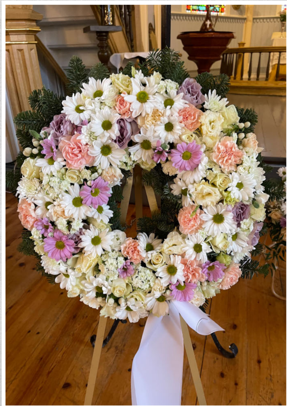
Ei siste helsing frå kollegaer i Helse Møre og Romsdal.