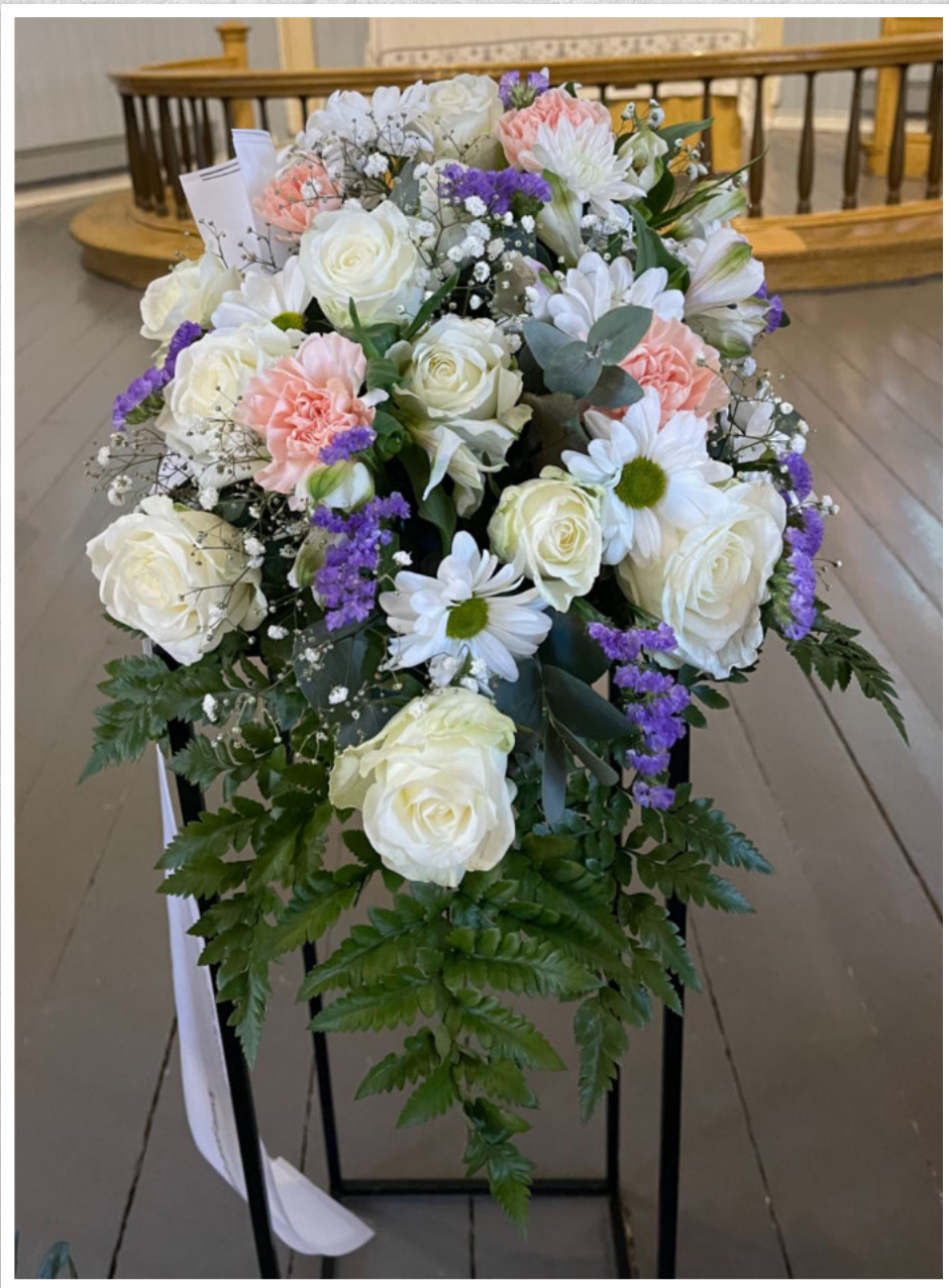
Kjære gode kollega. Ei siste helsing og takk frå oss som jobba på DPS Sjøholt og ambulans team.