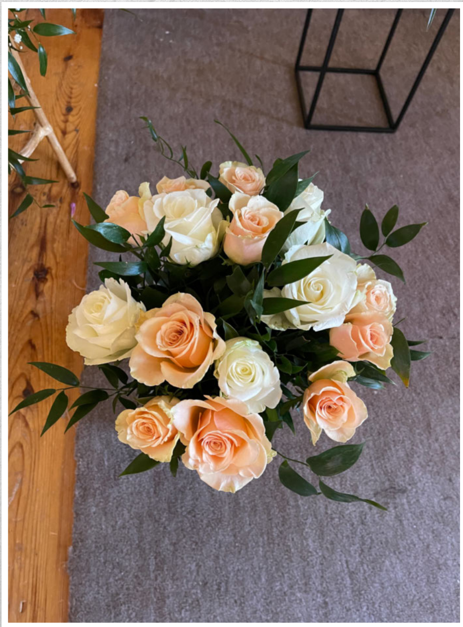
Ei siste helsing frå Torhild Valgermo, Rolf Hatlen med familie.