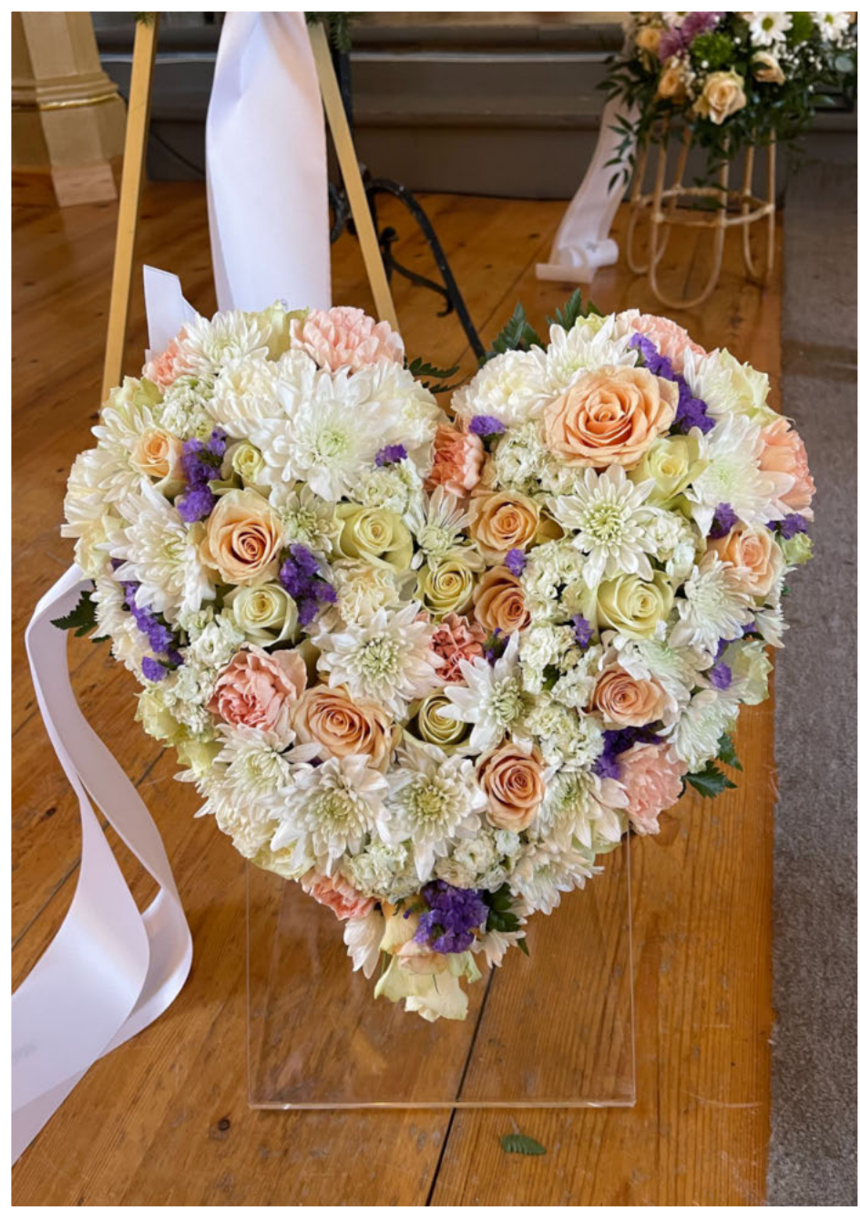
Takk for gode minner, kjære klassekamerat. Helsing C-klassen, frå barne-og ungdomsskolen i Førde.