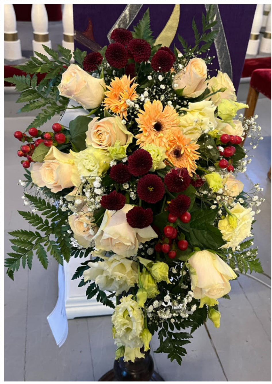
Ei siste helsing frå Anne Stette med familie.