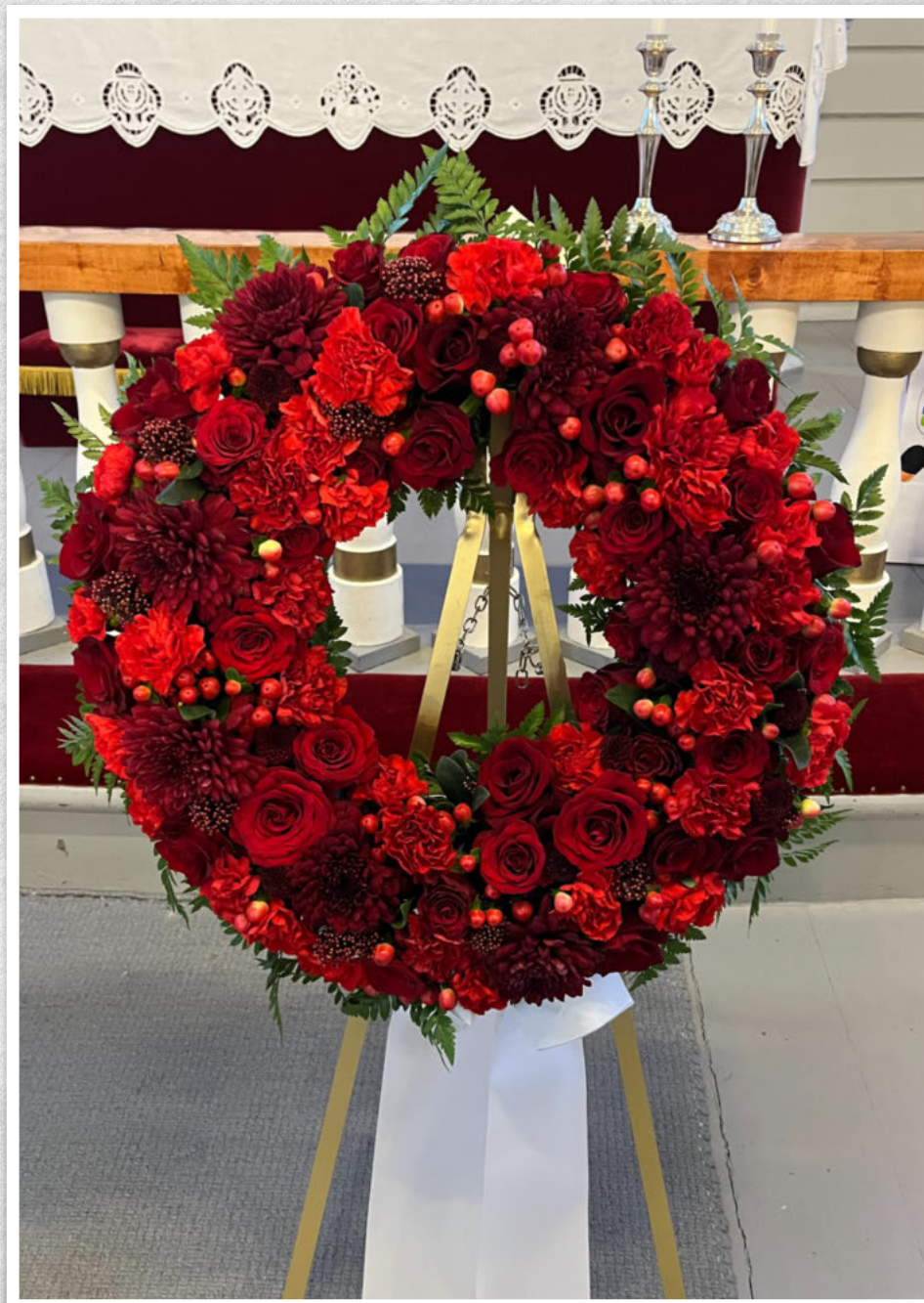
Takk for alle gode minner! Kvil i fred. Frå svigerinner og alle som kalla deg onkel.