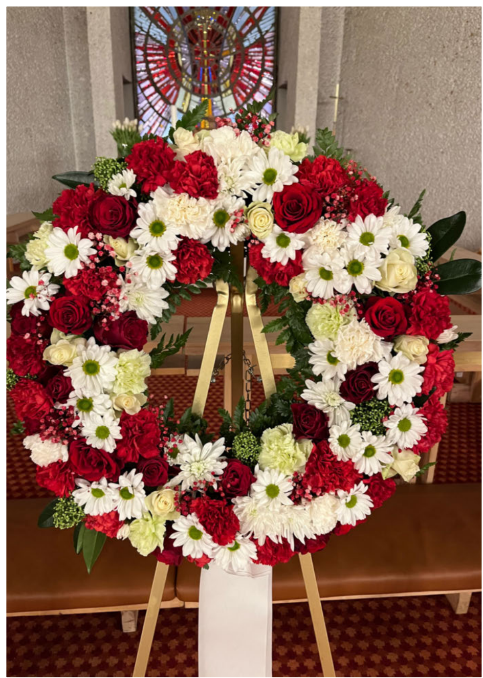
Takk for alle gode minne, kjære onkel. Hilsen fra alle du var onkel til på Hofseth-sida.