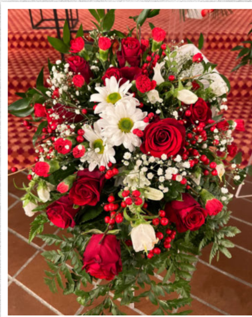
En siste hilsen fra familiene på Mauren.