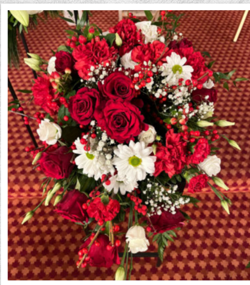
Takk for alle gode minne. Ei siste helsing frå Tante Sonja m/fam, onkel Lindy med familie.