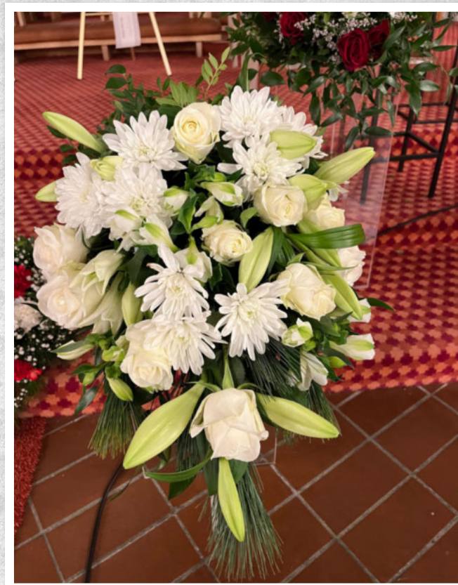
En siste hilsen fra tidligere kollegaer i VARD.