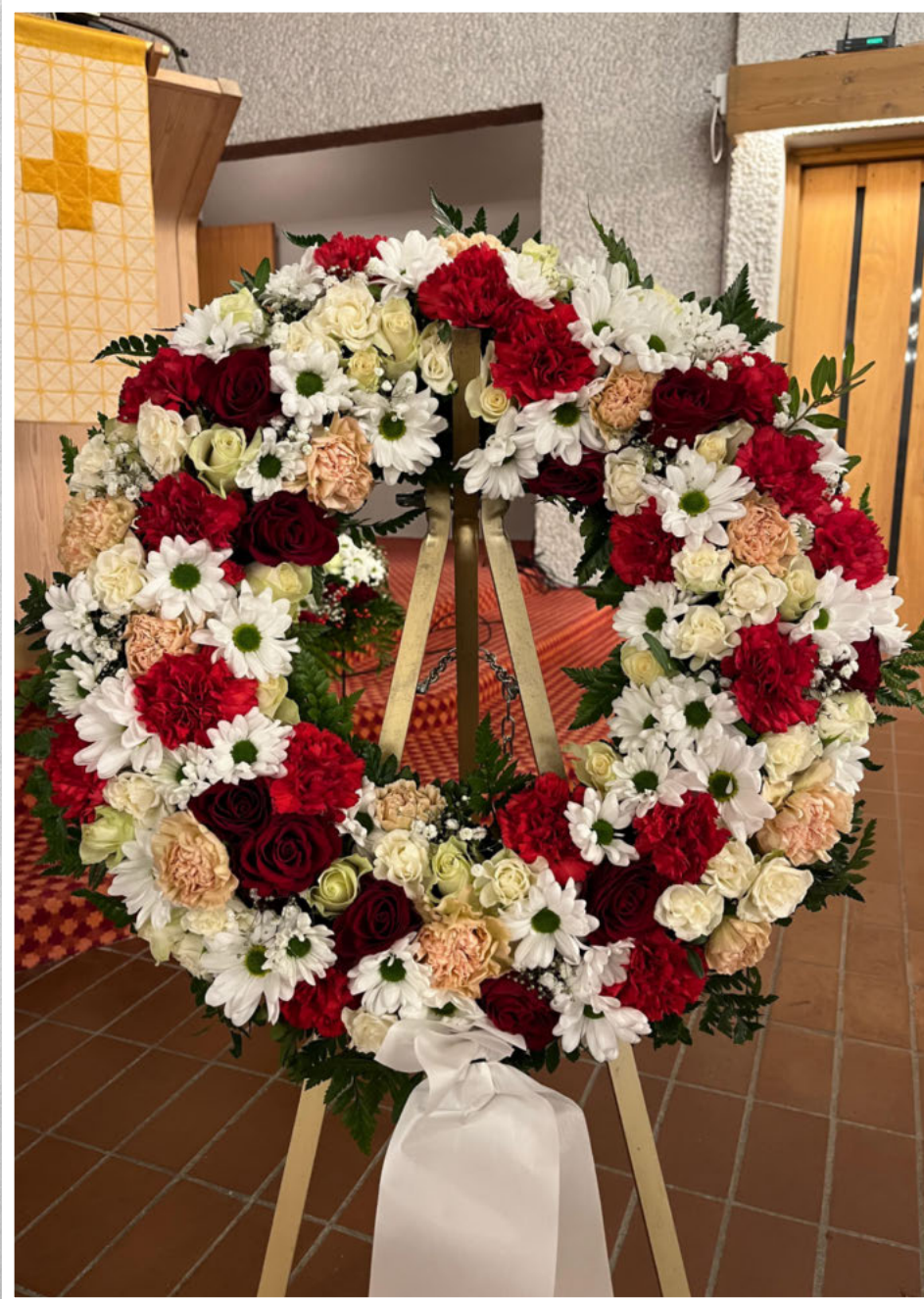
Kvil i fred. Takk for godt naboskap.