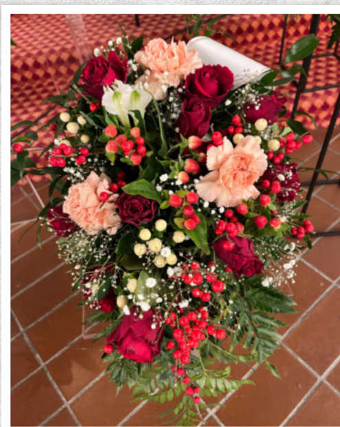
En siste hilsen fra alle dine bridgevenner.