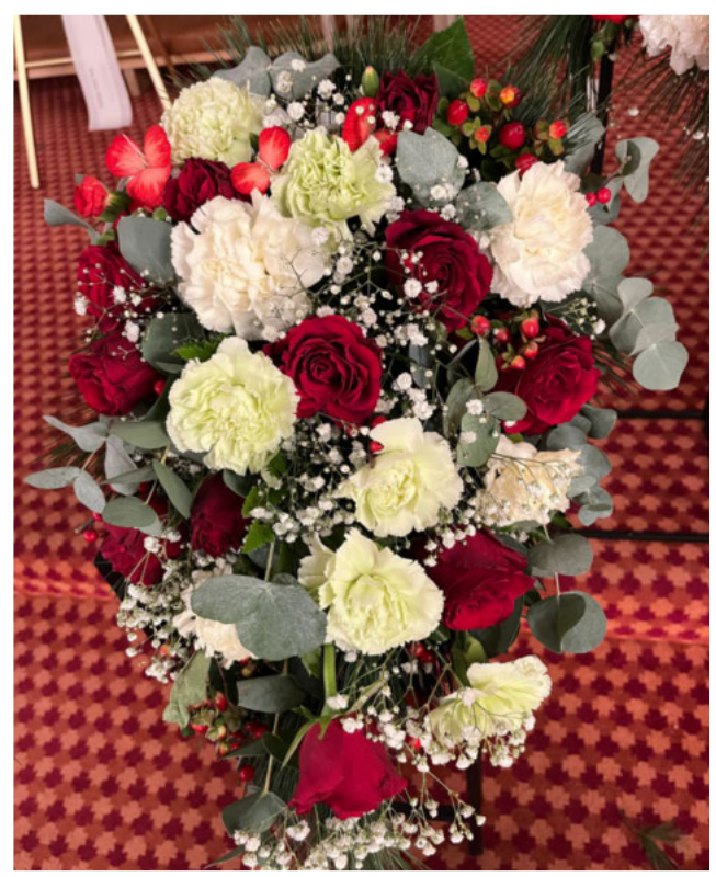
Takk for gode minne. Kvil i fred. Helsing familiane frå Osvika og Øvste-Hofseth.